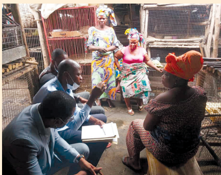
Séance de travail avec les femmes abatteuses de volailles du marché de Dantokpa