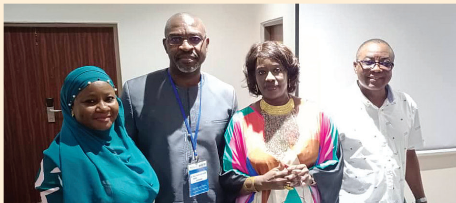
Le DG d'AFRISTAT avec les organisateurs du séminaire d'Accra