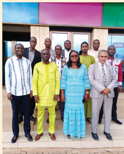
Les participants à l'atelier de Lomé

Du 19 au 23 septembre 2022, AFRISTAT a organisé à Lomé un atelier de présentation des indicateurs et élaboration d'une note de suivi des indicateurs de l'AS.