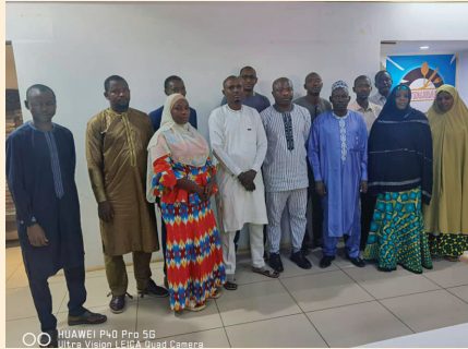
Les participants à l'atelier de Niamey